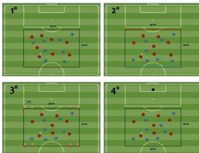
Figura 2. Representación gráfica de los cuatro formatos de juegos reducidos.

Los JRs se llevaron a cabo en un terreno de juego, previamente delimitado, con unas dimensiones de 20 metros de ancho y 40 metros de largo. Cada juego reducido fue realizado en dos ocasiones, siendo la posesión en fase de ataque completa para cada equipo. Por lo tanto, cada vez que el equipo defensor conseguía recuperar la posesión del balón, devolvía la posesión al equipo atacante. Siguiendo las recomendaciones de Mallo (2013) y Verheijen (2014) cada una de las repeticiones tuvo una duración total de cinco minutos y entre cada una de las series, se realizó un periodo de descanso de dos minutos.