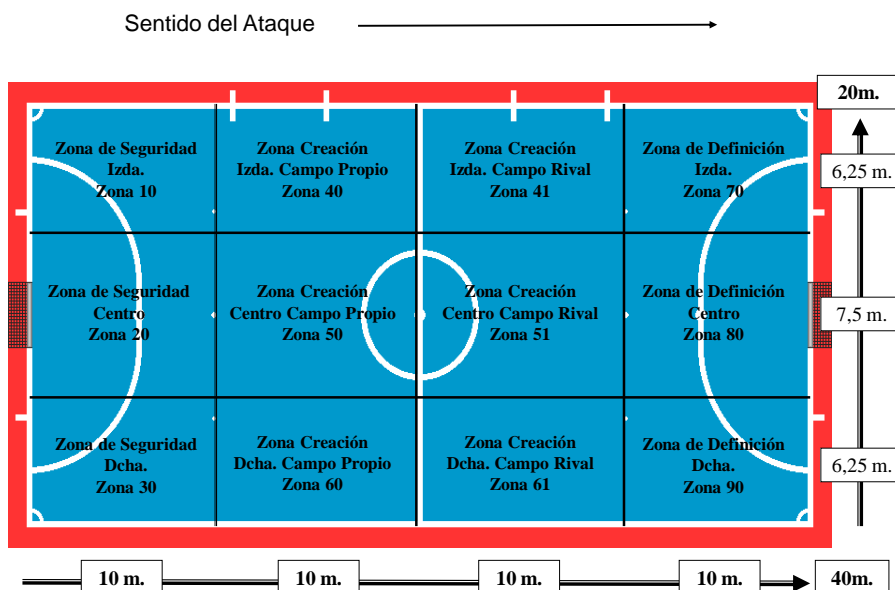
Figura 1. Distribución zonal del terreno de juego (Lapresa et al., 2013).

Además, para analizar la profundidad del juego se han fusionado las zonas del terreno de juego en sentido transversal para obtener cuatro sectores -véase figura 2-, a partir de Arana, Lapresa, Garzón y Álvarez (2004):