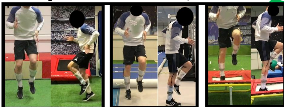
Figura 1. Carrera en el sitio sobre tres superficies distintas.

Sujeto en césped artificial, suelo técnico de caucho y trampolín plano.