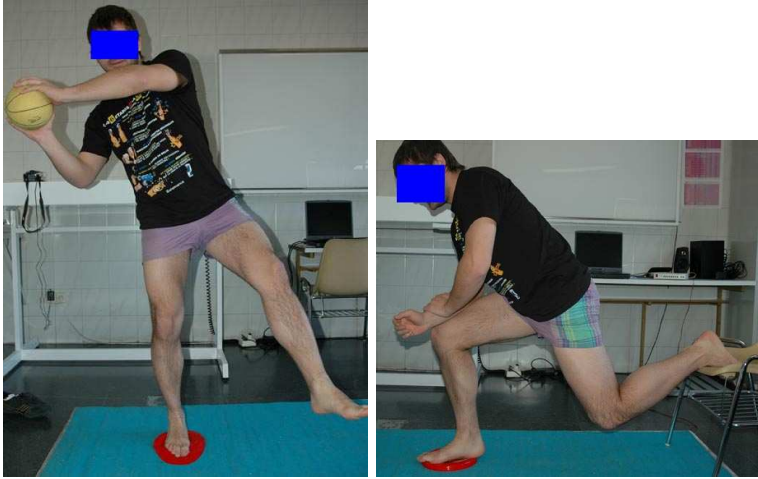
Figuras. 11 y 12. Ejercicios complejos de la Fase III de rehabilitación de la propiocepción.

La segunda fase o Fase IV de rehabilitación de la propiocepción, vamos aumentando la dificultad de los ejercicios en apoyo monopodal (saltar en un trampolín o sobre superficies de diferentes texturas con una sola pierna).