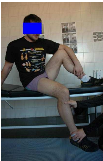
Fig. 3. Flexión activa asistida.

El apoyo progresivo facilita la recuperación del cuadriceps y consecuentemente disminuye el dolor en la región anterior de la articulación. El apoyo temprano hace que el paciente mejore su fuerza, mejore el grado de confianza y normalice su patrón de marcha lo antes posible (Barber-Westin & Noyes, 1993).