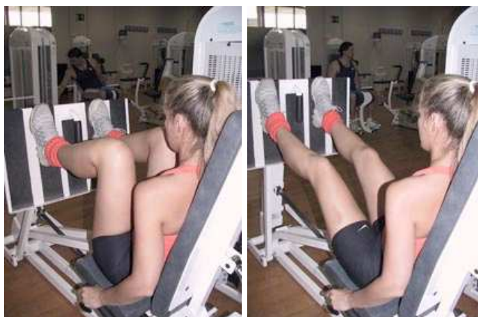
Fig. 7. Ejercicio de cadena cinética cerrada. "leg press"

Los ejercicios CCC teóricamente son los más indicados y seguros para esta etapa pues la co-contracción muscular durante su ejecución aumenta la estabilidad de la articulación y protege al injerto de las fuerzas transversales/cortantes de desplazamiento anterior.