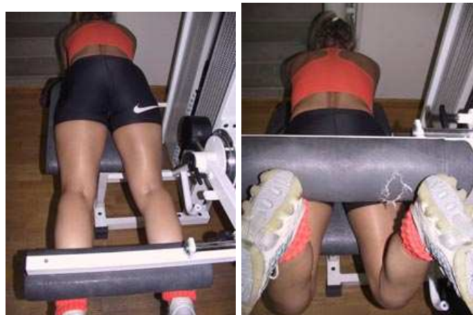
Figura 6. Ejercicio de cadena cinética abierta. “leg curl”