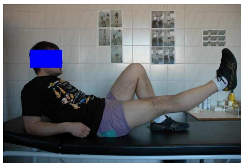
Fig. 1. Ejercicios isométricos de cuádriceps.

El uso de los ejercicios isométricos es de gran utilidad en esta primera etapa. (Fig. 1). Aunque su utilización y beneficio, no han sido suficientemente contrastados, existen algunos datos que le asignan una aceptable relación beneficio/riesgo (L.C. Thomson, Handol, & Cunningham, 2005).