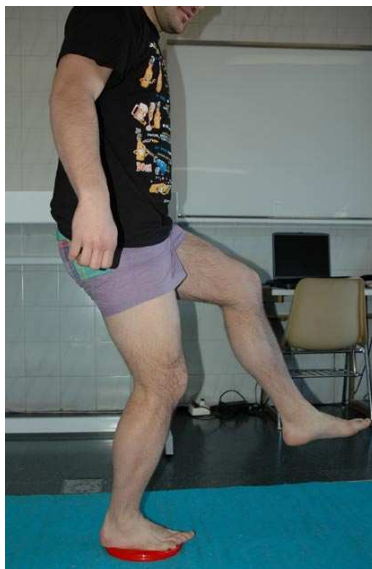
Fig. 10. Ejercicios de balance y estabilidad para mejorar la propiocepción.

estimulación disminuyendo los estímulos aferentes visuales (mantener los ojos cerrados), de esta manera obligamos al sistema vestibular y propioceptivo a mantener el balance articular (Hewett et al., 2002).