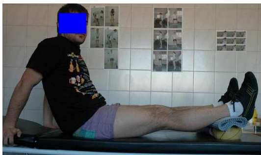
Fig. 2. Estiramiento forzado.